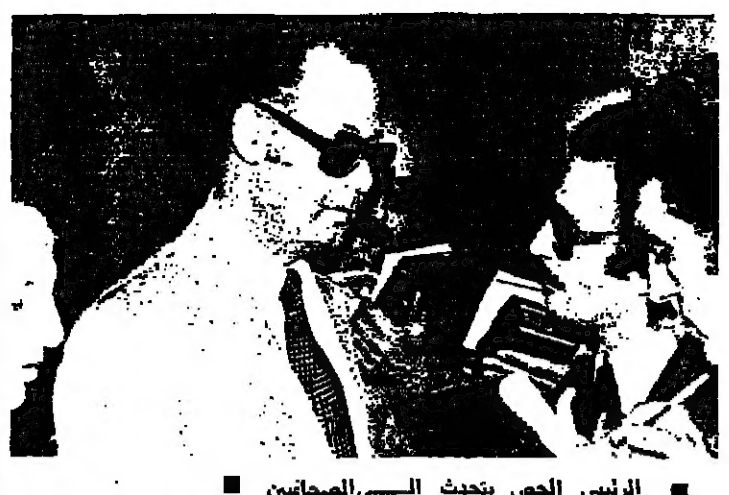
الرئيس الحص يتحدث مع الصحافيين

قال الرئيس عبدالله اليافي ان افضل واقرى رد عربي على نتائج الانتخابات الاسرائيلية هو ان تتفق جميع الدول العربية على انشاء حلف عسكري عربي ثمن له جميع الطاقات والامكانيات التي تملكها من مواجهة اي عدوان اسرائيلي ضد اي بلد عربي . واضاف : ان من شأن انشاء مثل هذا الحلف العسكري وضع حد نهائي لاي تفكير من قبل اسرائيل بتفكيك اي اطماعها التوسعية او القيام باي عمل عدواني ، بل ان ذلك كفيل بان يجعل اسرائيل تطوي صفحة اطماعها التوسعية . وطالب الرئيس اليافي بضرورة تحريك الدبلوماسية العربية باتجاه اقتناع امريكا وحلها على اجتناب اسرائيل على التنازل عن ثوابها وعرضها ازاء الوصول الى الحلول العادلة لمشاكل منطقة الشرق الأوسط . وفي هذا المجال قال النائب منير ابو غزالة : ان المطلوب اولاً وقبل كل شيء من الدول العربية في هذه المرحلة بالذات ، وفي ضوء نتائج الانتخابات الاسرائيلية ، وفي اطارها العربي على خطة سياسية موحدة لمواجهة المرحلة المقبلة وان يسود التفاهم العربي على نتائج الانتخابات الاسرائيلية .